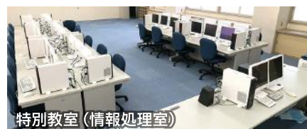
特別教室 (情報処理室)