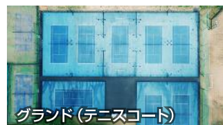
グラウンド (テニスコート)