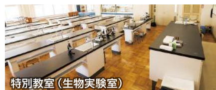
特別教室 (生物実験室)