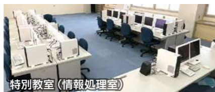
特別教室 (情報処理室)