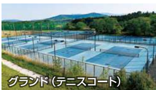
グラウンド (テニスコート)