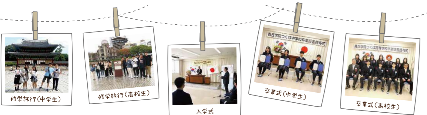
[中学・高校修学旅行] 関西方面 11月実施予定