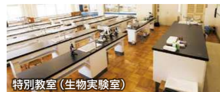
特別教室 (生物実験室)